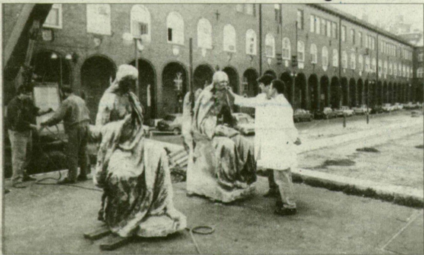
Nézopont kérdése... Mindkét felvétel tegnap délelőtt készült.

A Dóm téren tegnap bontották le Köllő Miklós kilencvenkilenc esztendő, hét méter magas Szentháromság-szobrát. A gazdagon díszített, neobarokk stílusú, homok-