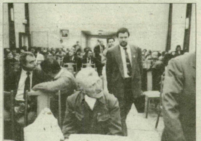
Tegnap Szegeden fogadták szakszervezeti vezetőiket a vasutasok.

„Mit veszíthetünk? Az érdekeink képviseletét, a kollektív szerződést, a vétőjogot. Mit nyerhetünk? Részvételt a vállalat vezetésében, a megélhetés biztonságát, az üzemi tanácsi választásokat.” (Írásunk a 6. oldalon.)