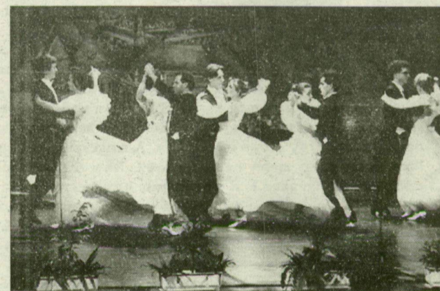
Nyitótánc: Pavane táncegyüttes.