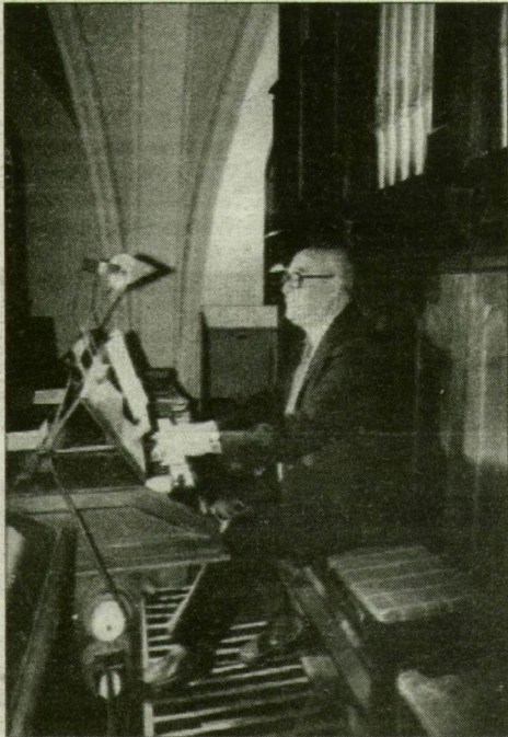
A templom orgonáját 1894-ben készítette a pécsi Angster cég.