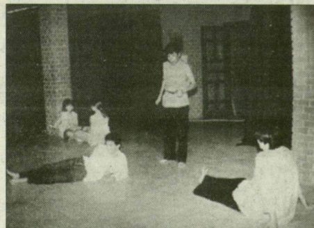
„...a gyerekek szeressék a művészetet!”

Szeged, Mérey u. 9/A. Tel.: 623/17-610 Ny.: H-P: 9-17, sz.: 9-12