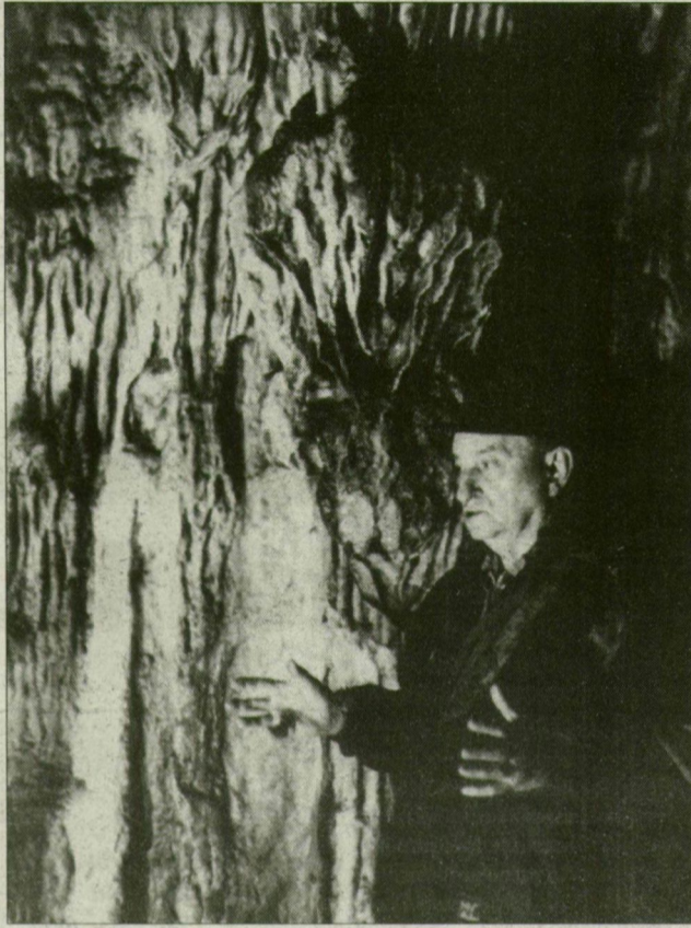
Cseppkőrengeteg a barlangban.

– Járják, és a járda drága. Hidak, és a híd is drága. Villany, és a föld alatti villanyve-