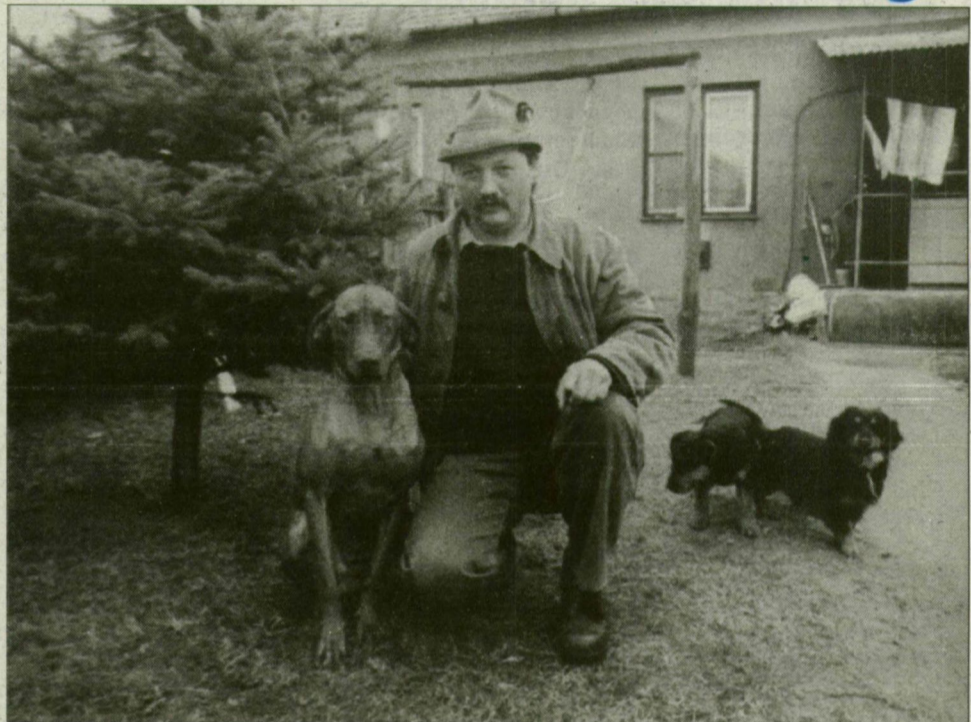
A gazdához kell szokni a kutyának...

dász olyan lusta, nem megy a lelőtt kácsáért.