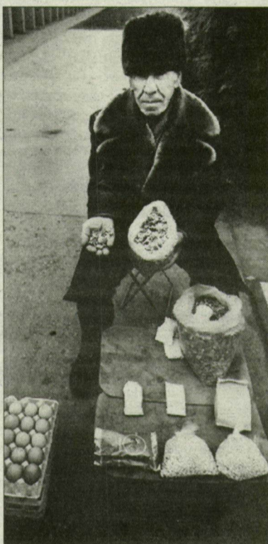
Miért kakukktojás a tyúktojás?

zolvány birtokában lehet. A rendelet meghozatala óta már eltelt néhány hónap, s ez idő talán elegendő a számvetésre. Annál is inkább, mert a téma sokakat érintő, amit bizonyít, hogy több olvasói megkeresés is érkezett szerkesztőségünkbe – általában kifogásolva, hiányosnak ítélve a határozatot. (Riportunk a 7. oldalon.)