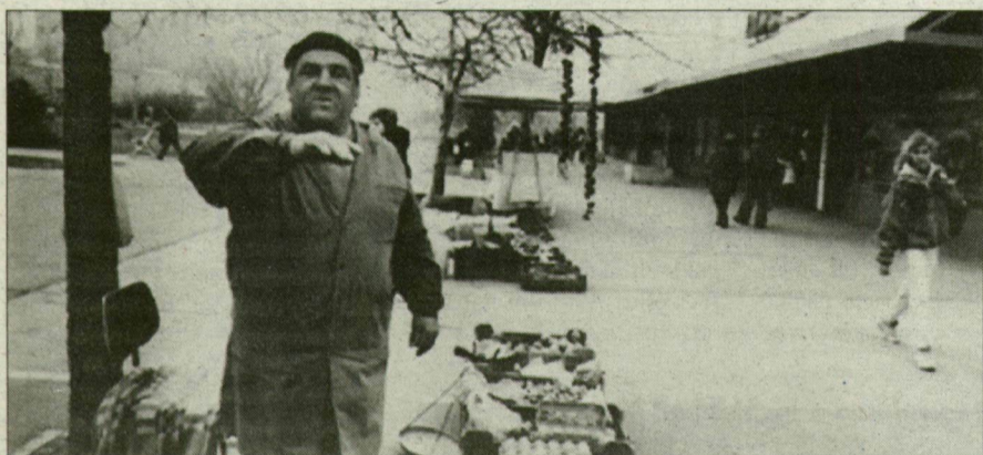
A Diófánál vásárlókat várnak – nem fotósokat.