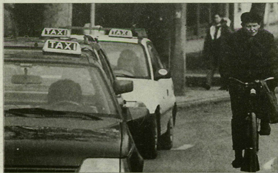
Csendélet a droszton. Sok taxi egy sorban.