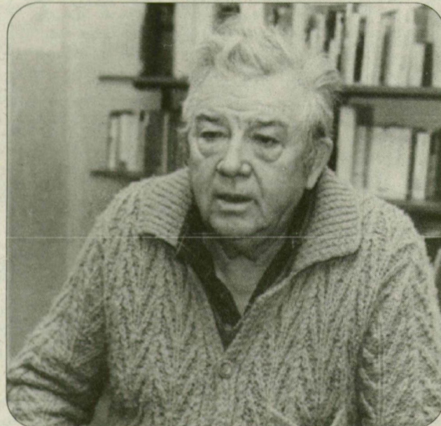
● „Az íróság narkózis. Nem lehet nélküle élni.”

jelent, meg azt, hogy nem a szükségképp keletkező forgács a fontos, bár rossz korokban abból csinálnak díszeket a Sztálinok feje köré.) Tóth Béla forgácsgyártók között maradt meg tisztességes asztalosnak. Mondhatnók, könnyű volt neki, mert mester. Csakhát a kor. Akinek nincs fantáziája, el se képzelje: írónk azért került konfliktusba az akkori ostoba hatalommal, mert azt merészelt mondani, hogy aki délelőtt nem volt eb, nem lehet kutya az délután sem. Titórol mondta. Akkor. Egy olyan megyében, amelyikben ez megbélyegzendő véteknek minősült. Frontmege volt.