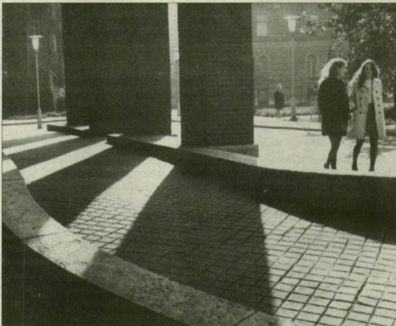
Az alkotó Fényzongora című képe