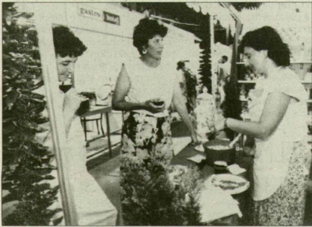
Díjazott stand a szegedi vásáron

Lelket mérgező tudat olyan munkahelyen dolgozni, ahol közelgő tizedelés, netán negyedelés hire járja. Kevés ember képes kivonni magát ezekből az izgalmból, ha számára befolyásolhatatlan szabály íratja azt a bizonyos listát. Az igazság pillanata fájdalom, de a maradék megkönnyebbülhetnek. Vagy jó munkaerőnek tarthatják magukat, vagy szerencsésen kapás szakmájuknak mondhatnak köszönetet. A Szegedi Paprika Rt. hatóság munkavállalójából 150-200 embert szólítanak meg a napokban azért, hogy a cég egy hónap múlva felmond nekik.