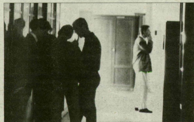
Erőgyűjtés az egyetem folyosóján.

(Írásunk az Egy százalék harmadik oldalán olvasható.)