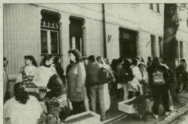
„...ez az átmeneti állapot, amit fiatalágnak neveznek, elviselhetetlen!” (Fotónk nem a riportalanyokról készült.)