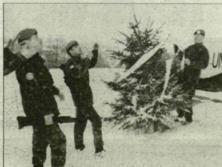
ENSZ-katonák karácsonya.

Huszonnégy órával elhalasztották pénteken a boszniai tűzszünet életbe léptetését – közölte Akasi Jaszusi, az ENSZ különmegbízottja és Radovan Karadzics boszniai szerb vezető. A tűzszünetnek péntek délelőtt kellett volna érvénybe lépnie a Jimmy Carter volt amerikai elnök közvetítése jóvoltából létrejött egyezség szerint. Karadzics