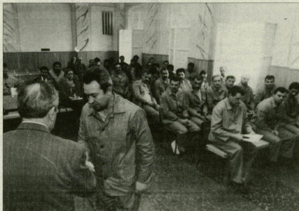
MI (is) segíteni akarunk! Jutalom a rendszeres véradásért.