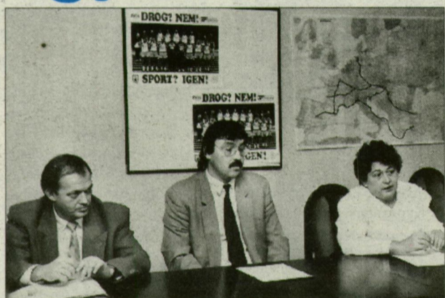
Tájékoztató a főkapitányságon – térképpel.

Olyan eredményt értek el a magyar, a megyei rendőrök a kábítószer elleni küzdelemben, amelyet a világ bármely bűnüldöző szerve szívesen kitenne az ablakba – tudtuk meg a tegnapi