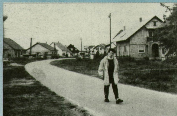
Sok szegedi is itt építkezik.

Nem tudom, Sándorfalván kívül van-e még egy olyan település a megyében, amelynek önkormányzata csupa független képviselőből áll. Talán a pártoskodás mellőzésének is szerepe van abban, hogy a nagyközség az elmúlt években sokat fejlődött. Amíg másutt általános jelenség a lakosság csökkenése, addig évente száznál is többel gyarapodik a sán-