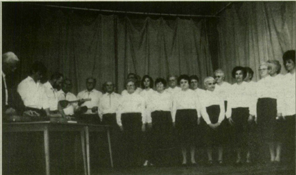
Az idén 20 esztendő Ruzsa Sándor Népdalkör és Citerazenekar.

A vasárnap kezdődött ötnapos tanácskozáson a szakszervezeti kérdések mellett napirendre tűzték a közép- és kelet-európai szervezeteknek nyújtandó szakmai segítség kérdését, a szervezeti keretek erősítését a harmadik világ országai- ban, valamint az Európai Unió létrejöttével kapcsolatos új kihívásokra adandó válaszokat.