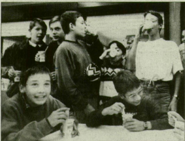
A Kodály téri diákok is a nyuszi „vendégei” voltak.

■ Három nagyvállalat – a Nestlé, a Milli-t gyártó Hajdútej és a Tetra Pak – fogott össze, hogy országos akcióban próbálja rábírní az iskolás gyermekeket arra, igyanak egészséges kakaót tízóráira. A Budapesti és az öt nagyvárosban zajló reklámkampány utolsó helyszíne volt tegnap Szeged. A város 14 iskolájában összesen 4880 gyermek kapott ajándékot a Nesquick-nyuszi: a szünetben egy-egy pohár kakót. A „Kakaószü-