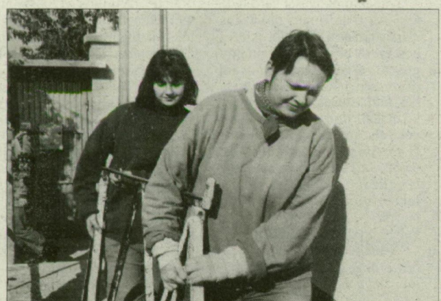
A fiúk keze alá lányok dolgoznak