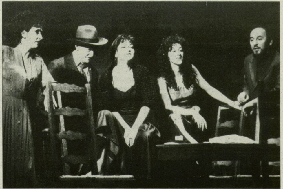
A csempészötös.