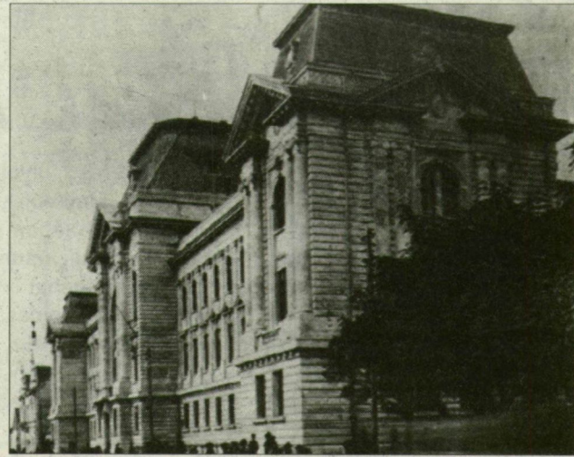
A beregszászi törvényszék épülete 1908-ban