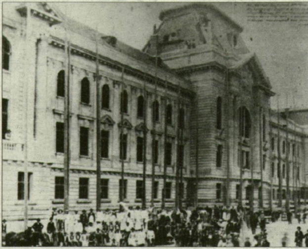
Francia barokk stílusban épült, a Louvre egyik homlokzatára emlékeztető épület lett