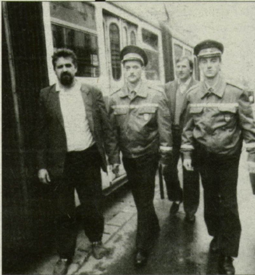
Az immár nem karszalagos ellenőröket rendőrhallgatók segítették. (Fotó: Révész Róbert)

■ Amint az lapunk keddi számában a Szegedi Közlekedési Kft. (régi nevén: SZKV) bejelentette: tegnap, szeptember 20-án, háromnapos ellenőrzési akció kezdődött, amelynek célja, hogy Szeged villamos- és trolijárait az átlagosnál kevesebben utazzanak jegy nélkül. A bliccelők ugyanis évente mintegy 14 millió forintos bevételkiesést „hoznak össze” a közle-