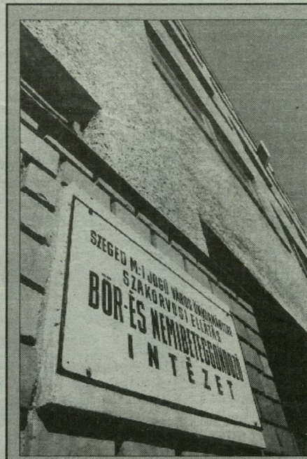
Mindennapos gyakorlat, hogy a betegek az utcán várakoznak sorukra. Nem

mintha nem lenne váró, csak hát az rendszeresen „csordultig” telve van. Szellőztetni nem lehet, mert a parányi ventilátor több zajt ont magából, mint friss levegőt. Ámbátor ha működ-tethető lenne, akkor sem nyernének vele sokat a benn-ülők, legfeljebb kipufogógázok at, mert a bőr-és nemibeteg-gondozó köz-vetlenül az ut-