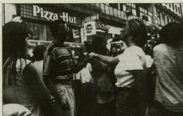
Többen táncra is perdültek.

Hát tegnap este hatkor Pizza Hut utcabál kezdődött Szegeden, a Kárász utcában, a gyorsétkeztető-hálózat mai megnyitását alkalmából. Az eseményről szerintem mindenki értesült, aki egy kilométeres körzetben tartózkodott, az erősítéssel és az akusztikával ugyanis semmi baj nem volt. A Cadillac együttes eddig szokatlan módon, keresztbe barikádozta el a sétálóutat, s a csaknem tökéletes hangzásnak köszönhetően érdemben beleszólt a környék lakóinak televíziózázába, a szerencsésekké, az esti mesébe és a Híradóba.