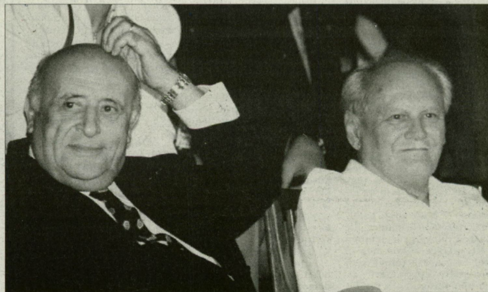
Suleyman Demirel török és Göncz Árpád magyar elnök népstadionbeli mosolya is jelzi: tudják, hogy futballban egyik ország sem nagyhatalom.