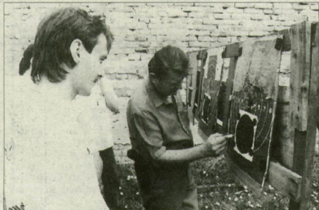
Szegediek a céltáblánál.

Szó esett a vajdasági katonaköteles fiatalok helyzetéről is. Keleti György kérte jugoszláv partnerétől, tekintse át: hogyan lehetne a korábban a katonaság elől elmenekült fiatalok elleni büntetéseket amnesztíával megszüntetni . A jugoszláv miniszter elképzelhetőnek tartja, hogy büntetés helyett a katonai szolgálatot utólag teljesítsék a fiatalok. Ez a kérdés jugoszláv belügy – hangoztatta Keleti György –, a vajdasági magyarok ottani képviselőivel kell megbeszélni. Egyes információk szerint a Vajdaságból nagyobb arányban hívnak be fiatalembereket sorkatonai szolgálatra. Erre a kérdésre a magyar minisztert arról biztosította jugoszláv partnere, hogy a Vajdaságban nem nagyobb arányú a bevonultatás, mind más nemzeti-ségek körében.