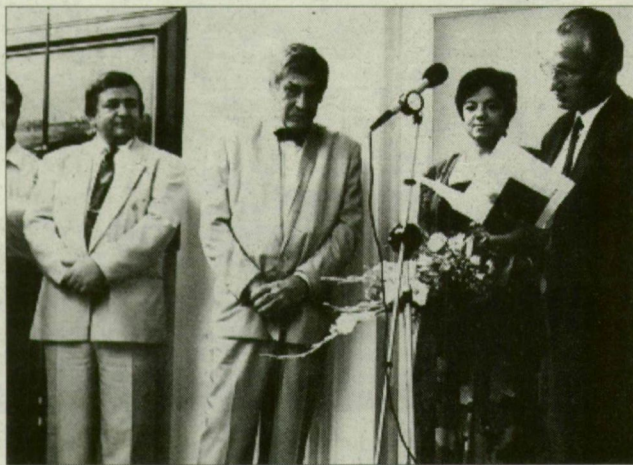
Középen az ünnepelt.