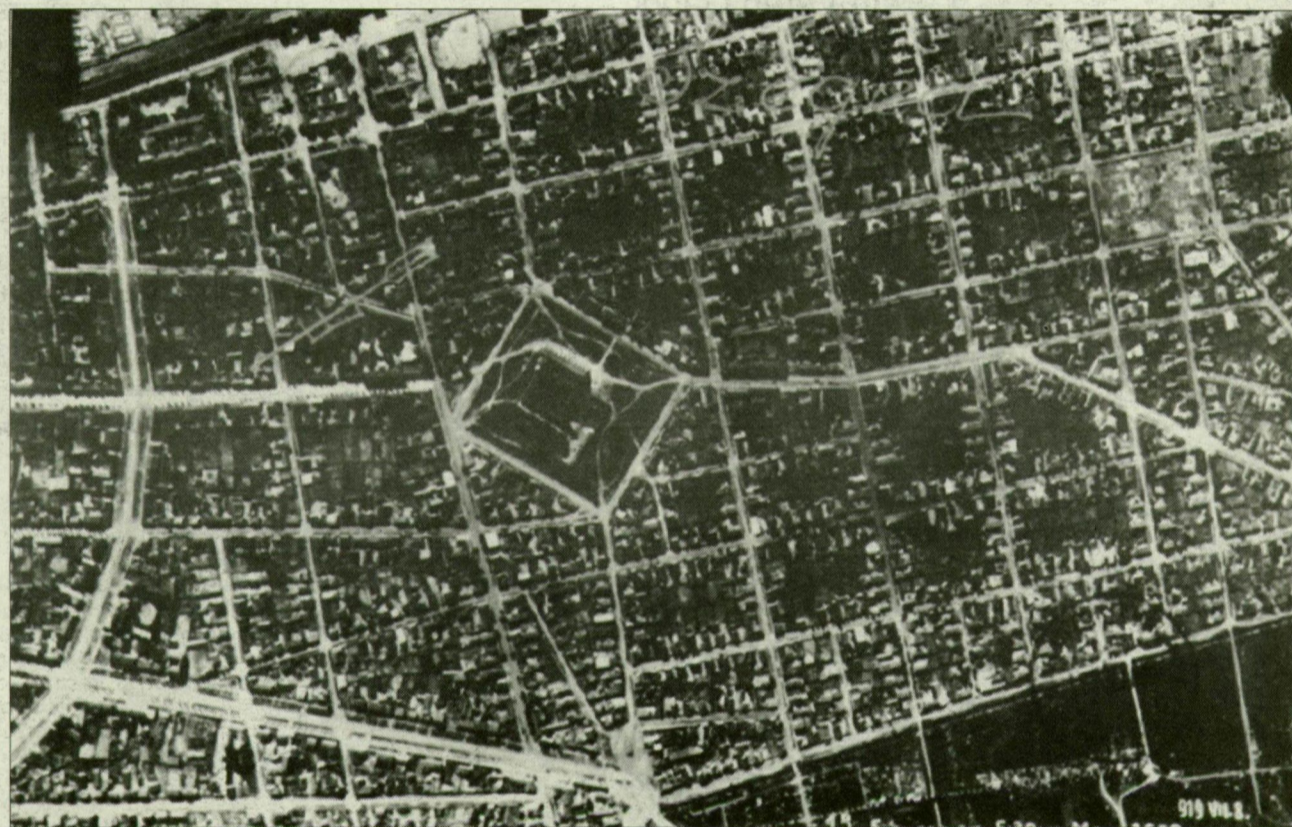
A szegedi Alsóváros

Az Országos Hadtörténeli Múzeumból nemrég került elő vagy két doboznyi régi üveg-lemez-negatív, és néhány fotópapír-(kontakt)-másolat az egykori Hadügyi Népbiztosság parancsára felállított magyar katonai térképező csoport archív anyagából. Valamennyi 1919 júliusában készült, az egykori tiszai offenzíva városai fölött, 2000–2800 méteres változó magasságban. A felvétel sorszáma, a repülési magasság és a dátum minden lemezre fekete vegytintával van ráírva, a másolatokon fehérben olvasható. A felvételeket készítő „kézikészülék” 30 centiméteres fókusz távolságú optikai rendszerével egy majdnél félméteres hosszú, több kilogramm súlyú kezdetleges fényképező kamerára enged következtetni. Hrenkó Pál tudós katonai térképtörténész kutatásából tudjuk, hogy abban az időben még nem voltak fenéklakos rögzíthető kamerák, hanem a több ezer méter magasságban repülő gépben a pilóta mögötti ülésből kihajolva, kézből készültek ezek a felvételek. Ahhoz képest igen jó minőségűek!