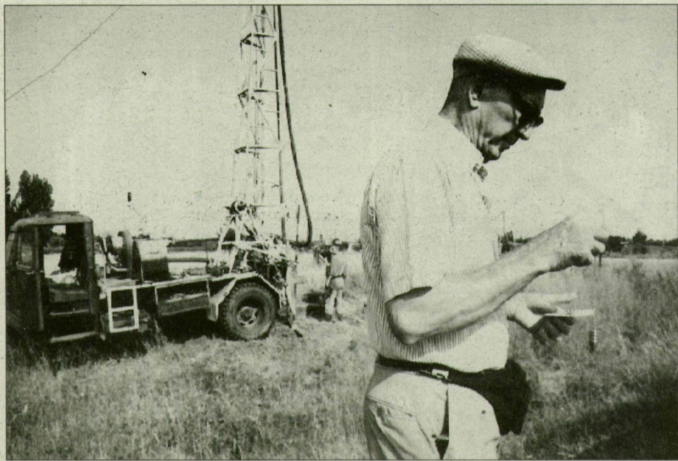
Atila koporsóját keresték Algyőn.