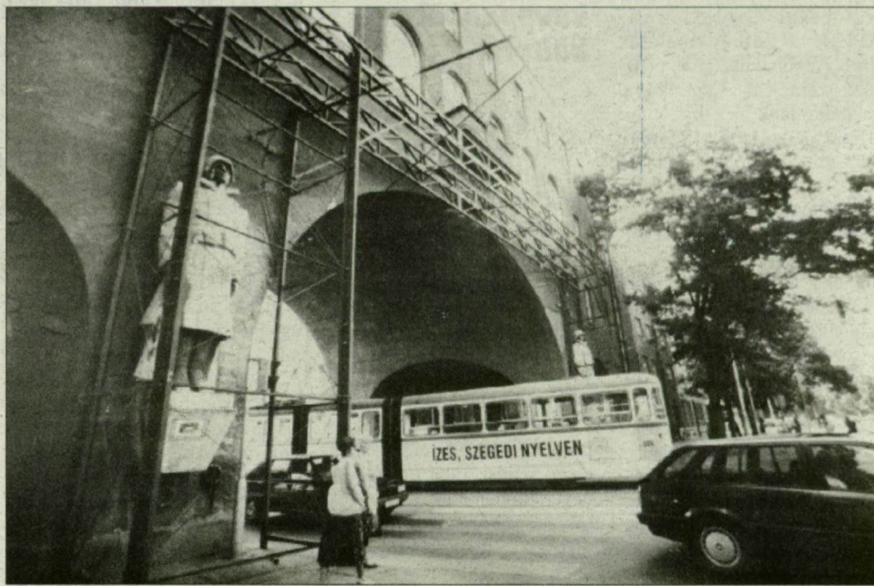
Fotó: Nagy László