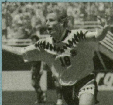
Gólöröm – Klinsmann-módra

A németek kezdtek jobban és a 12. percben egy szépségdíjas góllal szereztek meg a vezetést. Hassler jobb oldalról Klinsmannhoz játszott, aki jobb lábbal felpörgette a labdát, majd ballal egyből, kapásból, fordulásból nagy gólt lőtt a jobb alsó sarokba (1-0). Nem sokkal később, a 20. percben Buchwald szánta el magát lövésre, a labda a kapufáról Riedle elé pattant, aki hidegvérrel az üres kapuba küldte azt (2-0). Ezután Buchwald hagyott ki százszázalékos gólhelyzetet. Igaz, a koreai Hong is ezt tette két esetben is. A 37. percben Klinsmann óriási kapushibából szerzett újabb német gólt. (3-0). Ezzel a szőke német