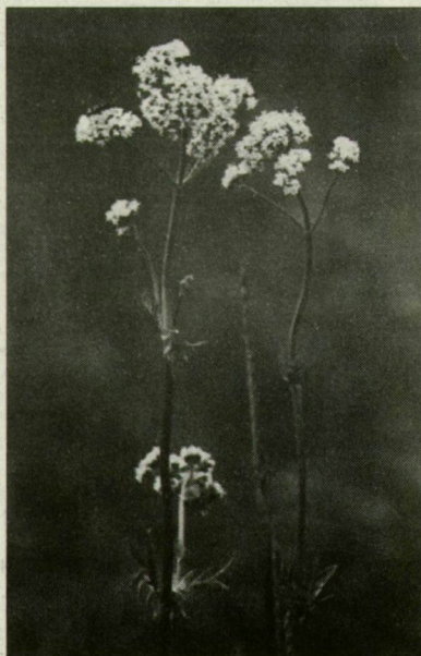
Az angyalgökören billegő lucernacincér

hettünk, hogy kárpótlásként hol kívánjuk kimeríteni.