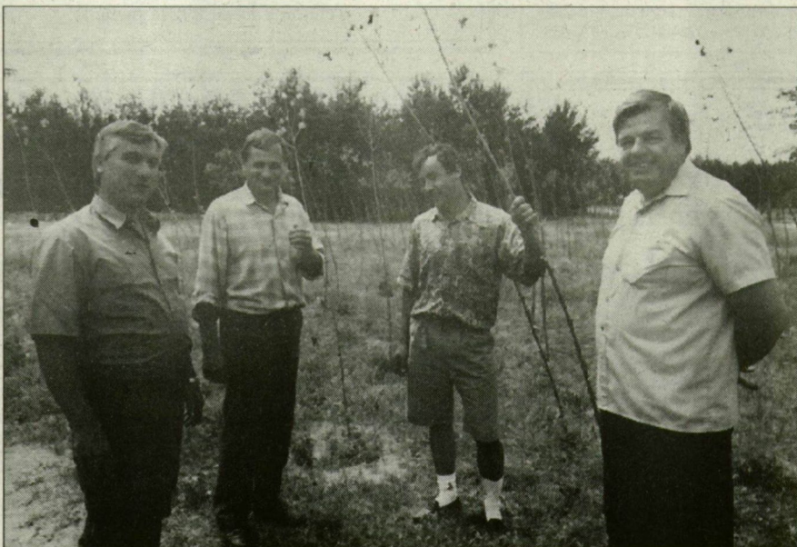
Természetvédő vállalkozók.

bronzal, kékkel, sárgával tarkított, ligetes pusztá látványa nyílik ki előttünk. A motor zúgására mezei pacirtapár röppen a magasba, fölöttünk kifeszített szárnyú ragadozómadár köröz. Kiszálunk. Csönd, napfény, szélfújta ligeterdő maradványa, sásos, nádas, szélében ósgyep tarkítja a tájat.