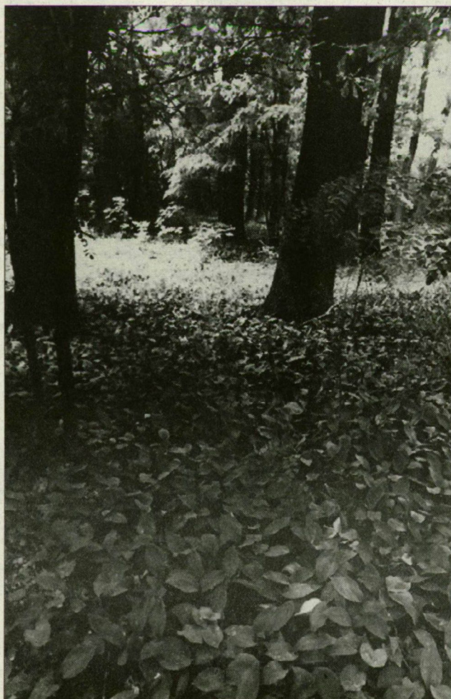
A védett gyöngyvirágos tölgyes