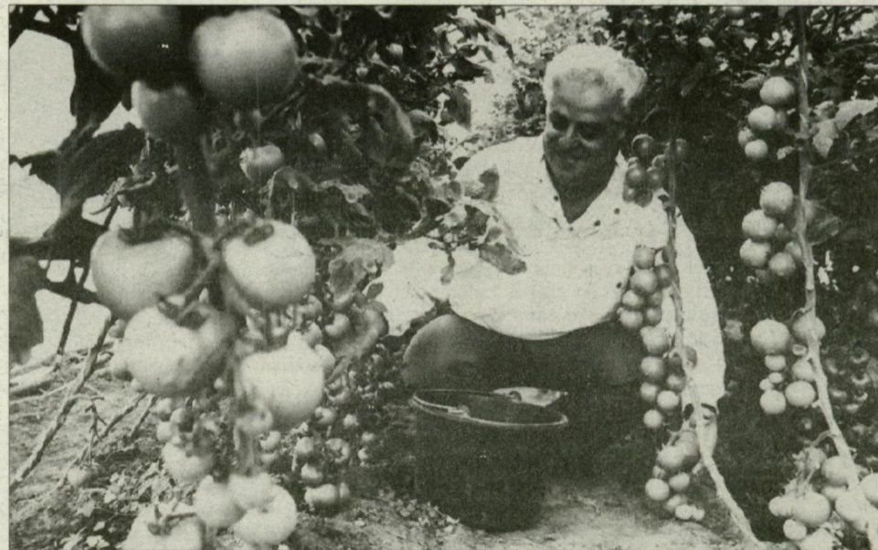
Igazi földi paradicsom.