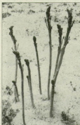
Nem kívánatos kibúvók.

A bakhátaban kapingálók közül többel szóba elegyedtem, de megígértették velem, hogy a nevüket véletlenül se