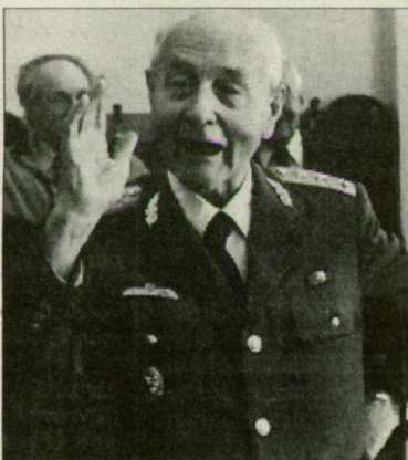
Schmidt Andrea felvétele a nyugalmazott tábornok legutóbbi szegedi látogatásán készült

Kéri Kálmán az elmúlt években két magas kitüntetést kapott: 1991-ben a Magyar Köztársaság Babérkoszorúkkal Ékesített Zászlórendjét, tavaly pedig a Magyar Köztársasági Érdemrend Nagyeresztését a II. világháború alatt az ország és a nemzet megmentéséért folytatott Hitler-ellenes politika szolgálataért, önfeláldozó magatartásáért, valamint a Magyar Honvédség újjászervezésében végzett kimagasló tevékenységéért.