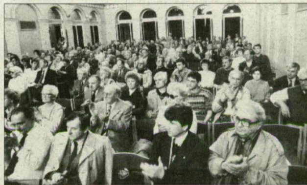
Megtelt a Tisza-szálló nagyterme.