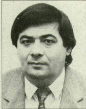
Pap Imre 5. sz. választókerület