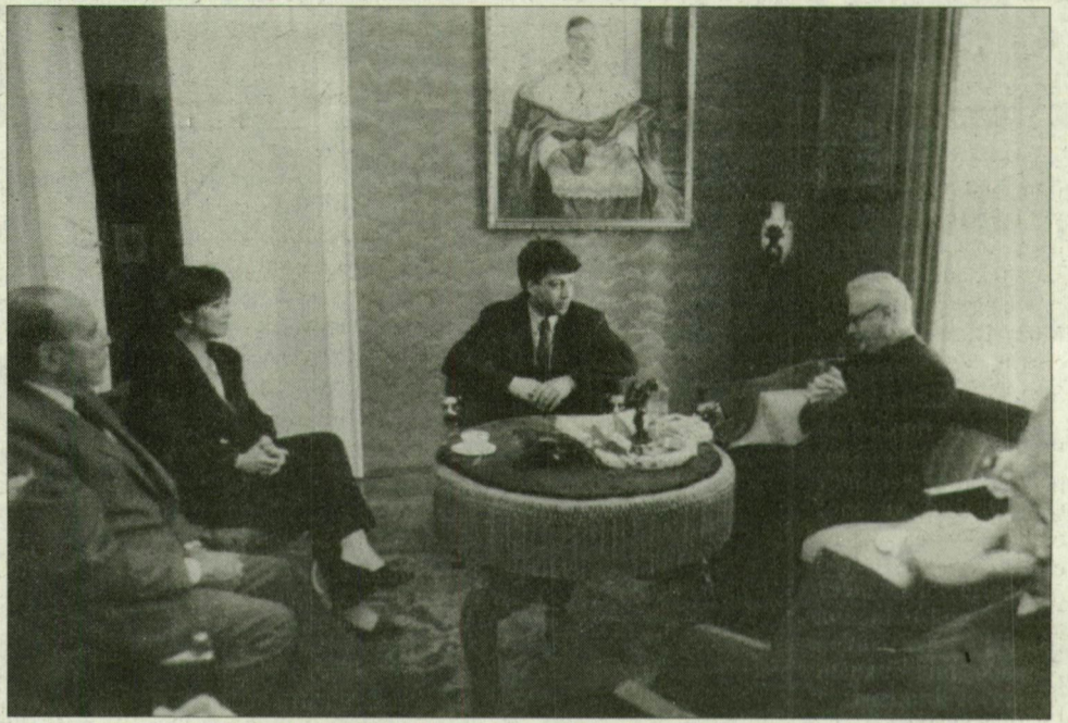
A pártelnök a püspöki palotában találkozott az egyházak vezetőivel.

Pető a sajtótájékoztatót megelőzően az egyházak vezetőivel