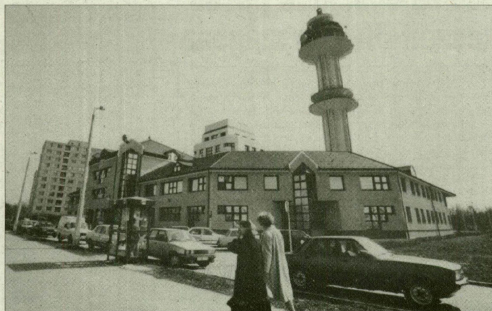
A Rókusi körúti új telefonközpont hamarosan francia „vezérlés” alá kerül.

Az elítéltek átszállításáról szóló egyezmény lényege, hogy az egyik szerződő fél területén elítélt személy a kiszabott büntetés letöltése céljából átszállítható a másik fél területére.