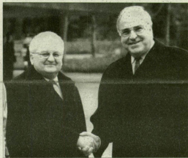
Boross-Kohl-kézfogás.

■ Helmut Kohl német kancellár kedden Bonnban „bölcset” nevezte, hogy Magyarország még az év első felében be kívánja nyújtani csatlakozási kérelmét az Európai Unióhoz, megjegyezve ugyanakkor, hogy nem akar belebeszélni a magyarok dolgaiba.