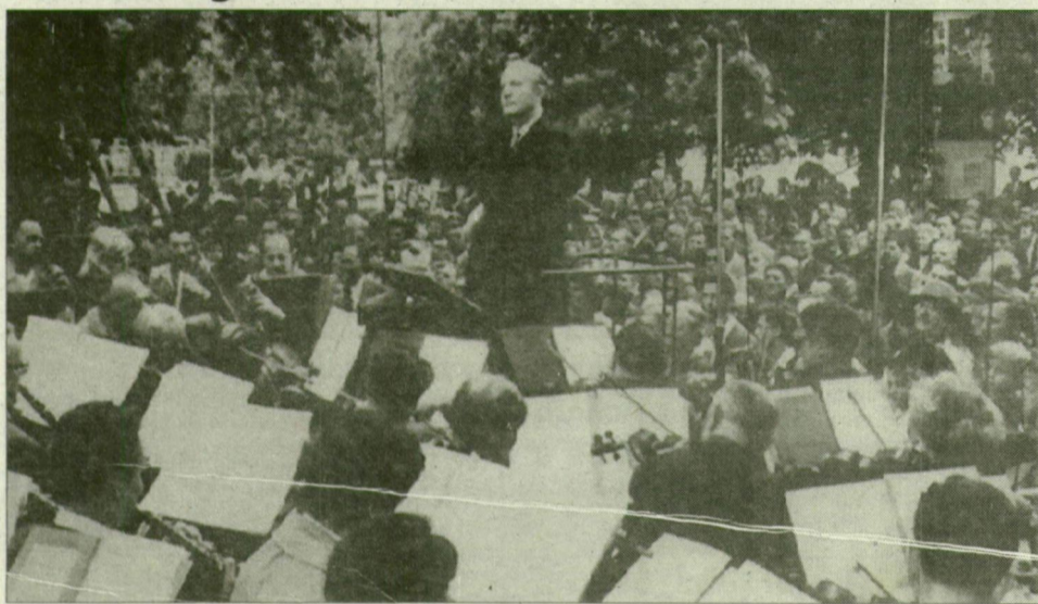
Hangverseny a Széchenyi téren, az országos dalostalálkozón, 1960

Szép kiállítás, alapos anyagot ismertető és hangulatos könyvet vehet kezébe az olvasó, Vaszy Viktor, a zeneszerző, karmester és művészszervező egyéniség születésének 90. évfordulóján. Szeged város önkormányzata megbízásából a Somogyi könyvtár kiadásában 200 oldalon, gazdag fotóanyaggal illusztrálva Vaszy Viktor emlékezete címmel megjelent az a kötet, amely a művész Szegeden oly nagy hatású tevékenységét mutatja be és örökíti meg. A könyv szerkesztői, Gyuris György és Papp Györgyné áttekinthető, több oldalról megvilágított anyagot rendeztek kötetbe. A fejezetek során elsőként Vaszy Viktor sajtóban közölt művészeti, művelődéspolitikai írásait, nyilatkozatait, az 1946-tól többek között a Délmagyarországban, a Tiszatájban és a Muzsikában a szegedi színházról, az operáról, a szabadtérről s a városi hangverseny-letről megjelent cikkeit találja az olvasó. A sajtó írásokat bő-