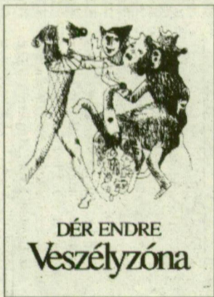
DÉR ENDRE Veszélyzóna

részletet már lapunkban is olvashattak).