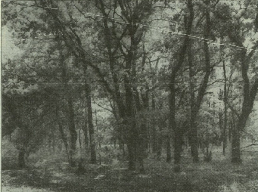
Pusztai tölgyes Ásotthalom környékén.