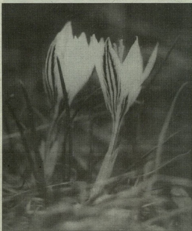
Tarka sáfrány. A homokvidék egyik legkorábban viritó védett növénye.

nevelésre hiába hivatkozunk. Ha valakinek anyagi érdekelt-sége van, akkor az fog érvényesülni. Profitorientációról van szó: a gazdálkodónak azon a területen mindenképp pénz kell termelni, s ilyenkor „néhány gaz miatt” nem halasztja el a tábla beszántását. Ez a „pár szál virágnál egy satnya tők is többet ér” szemlélet