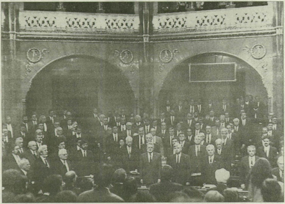
A parlamenti képviselők egyperces néma felállással adóztak Antall József emlékének

Az ügyvezető kormány nem kíván nemzeti gyászt elrendelni, de arra kéri az intézményeket, hogy országszerte tűzzék ki a gyászlobogót az elhunyt miniszterelnökre emlékezve – mondotta tegnap Juhász Judit szóvivő. Az ügyvezető kormány vasárnapi rendkívüli ülésén határozott így; a kabinet ugyanis úgy tartja, hogy a kegyeletes megemlékezés szerényebb formája méltóbb Antall József mértékértartó közéleti munkásságához.