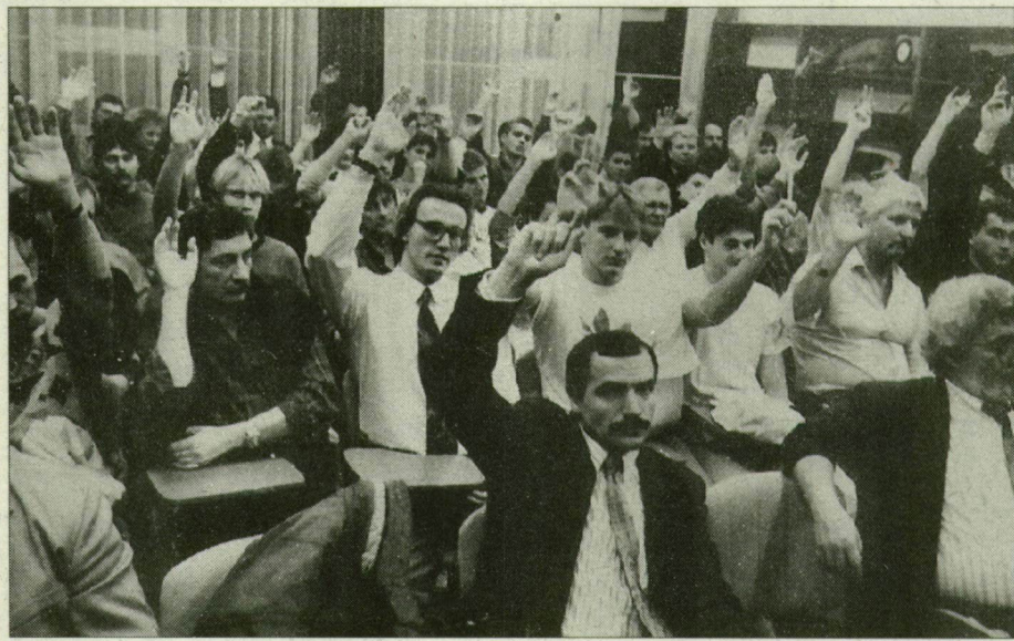
Megszavasták: megszűnt a Szeged SC