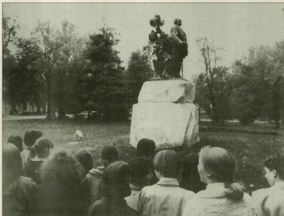
Deák Ferenc születésének 190. évfordulóján tegnap délután a Széchenyi téri szobornál koszorúztak a Deák Ferenc Gimnázium tanárai és diákjai.

rése: így s ezért valósulhatott meg 1867-ben a kiegyezés.