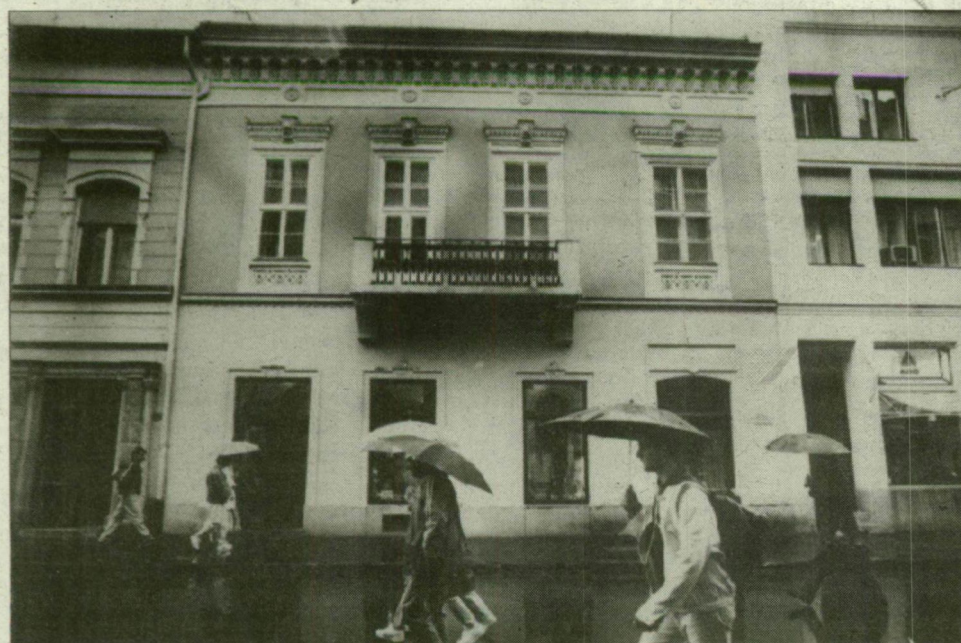
Visszaperlik a nyomda „tengeri kijáratát”