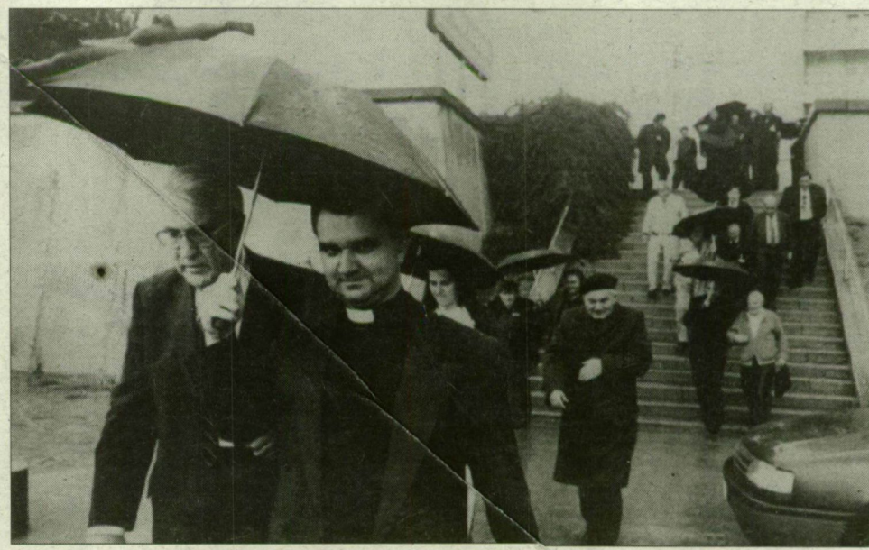
Isten vize ömlik ugyan, de a konferencia résztvevőit várja a hajókikötés.