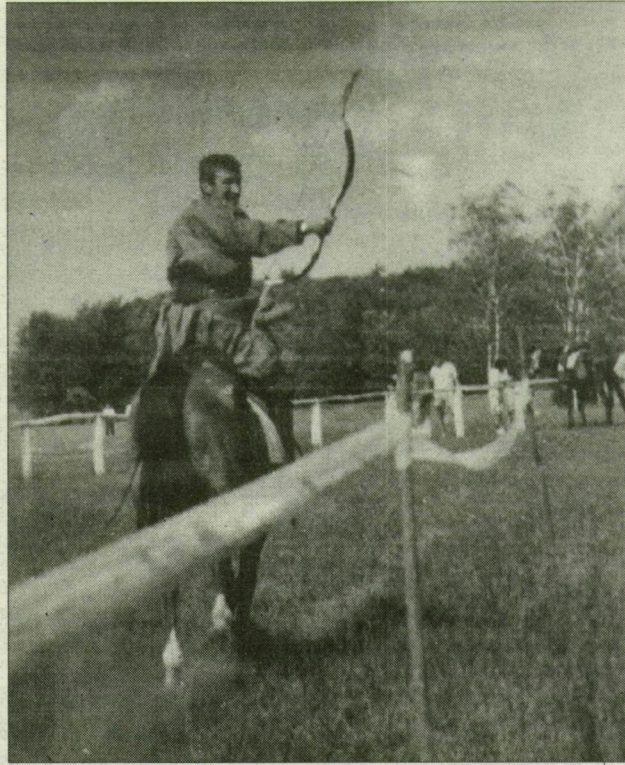
„Vitézek, mi lehet ez széles föld felett...” Kaposmérői lovas íjászok Ópusztaszeren.