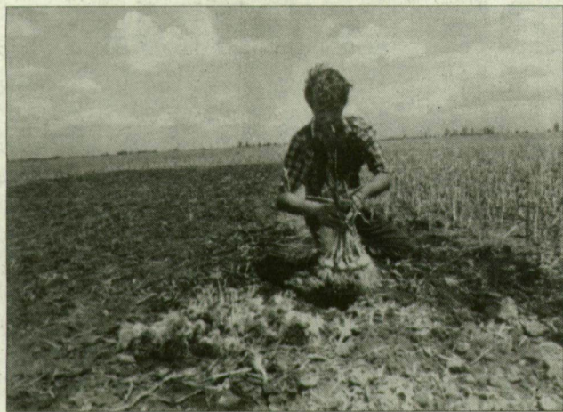
A föld – vihar után.