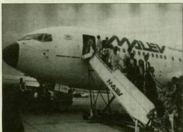
A „protekciosok” már a szombati rajt előtt kipróbálhatták a Boeingot, igaz, csak Bécsig