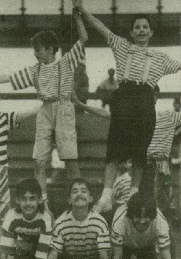
Az Alsóvárosi Általános Iskola cirkuszi erőművész csoportja.

Nemes céllal kezdett szervezőmunkába még januárban a Szeged Városi Tisztiorvosi Szolgálat. Az egészséges életmódra nevelést legjobb az általános iskolában kezdeni - ez volt az alap gondolat, s ennek jegyében keresték meg az iskolákat. Az eddigi munka eredménye vasárnap a város több helyszínén is látható volt: a Sportsarnok, az Ifjúsági Ház, és a Városi Tisztiorvosi Szolgálat Sólyom utcai épülete látványos programokkal várta a gyerekeket - és szüleiket; hiszen a gyermekek segítségével még a szülők is nevelhetők... És persze az is fontos, hogy minden előadón gyerekek játszottak gyerekeknek. Az Egészséges Szegedért Alapítvány, a Sportsarnok, és az Ifjúsági Ház támogatásával létrejött rendezvények az