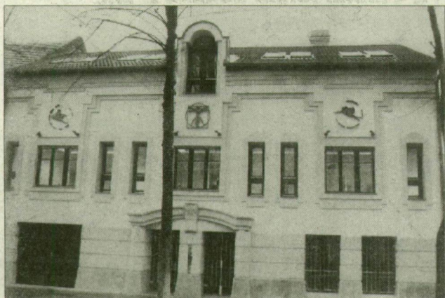
Az elhunyt szobrász utolsó munkái Szegeden