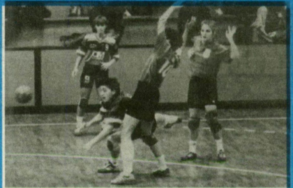
Tudósításunk a 9. oldalon.