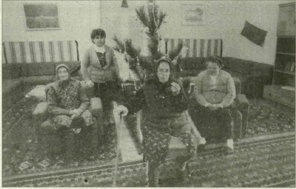
Békésen, pihenéssel telnek az idős emberek napjai a napköziben.

Az apadó pénzforrásokat sajátos módon próbálják bővebben csörgedezőbbé tenni, hogy változatlanul jó színvonalon láthassák el az idős embereket. Az Öregek Napközi Otthonában azt kezdeményezték, hogy hozzanak létre alapítványt a település öregeiért. Ennek alaptökéje lehetne egy közelmúltban elhunyt idős asszony hagyaték, az önkormányzatra testált házának eladásából származó