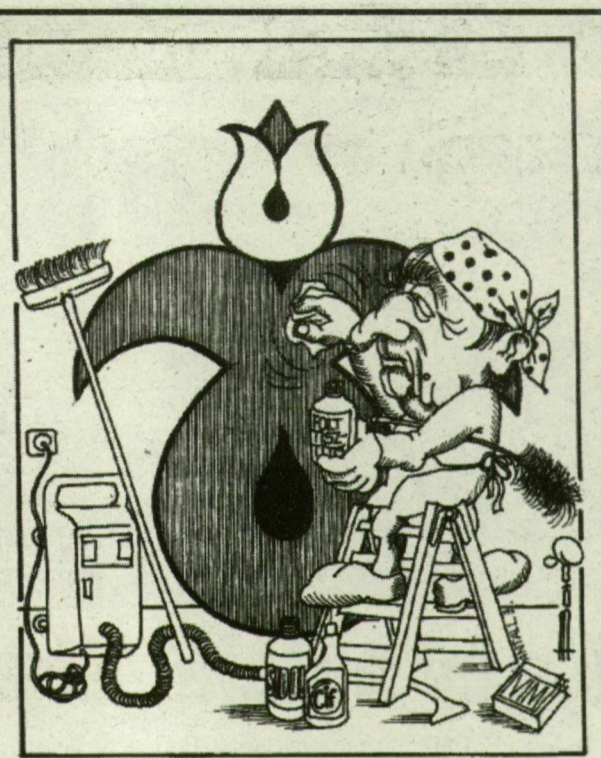
Hétfői nagytakarítás! Avagy csak tisztogatás?